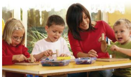
Seite 3 – Porträt: SOLIDAY – die Antwort auf die «moderne Armut» in der Schweiz.