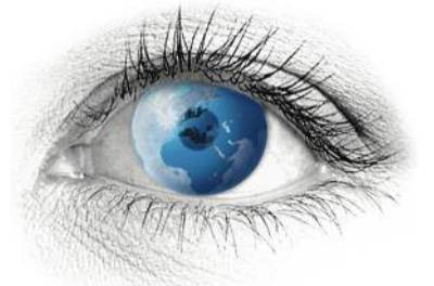
Seite 4 – Megatrends – Entwicklungen, die das Marketing prägen.