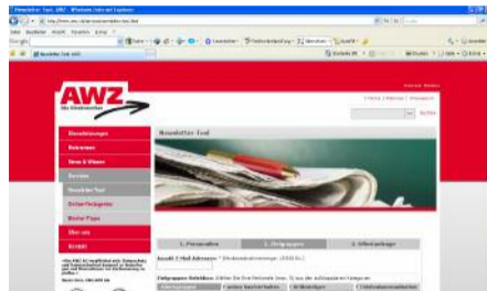
Seite 2 – Das AWZ-Newsletter-Tool – So einfach funktioniert es.